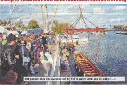
Het publiek keek vol spanning toe bij het te water laten van de sloep.