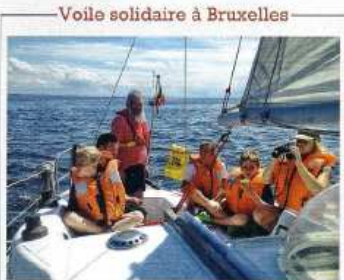
Voile solidaire à Bruxelles

C'était par une nuit d'hiver, en 2011, à Bruxelles. Huit amis passionnés décident de fonder l'Atelier marin pour partager leur passion de la navigation, notamment avec les