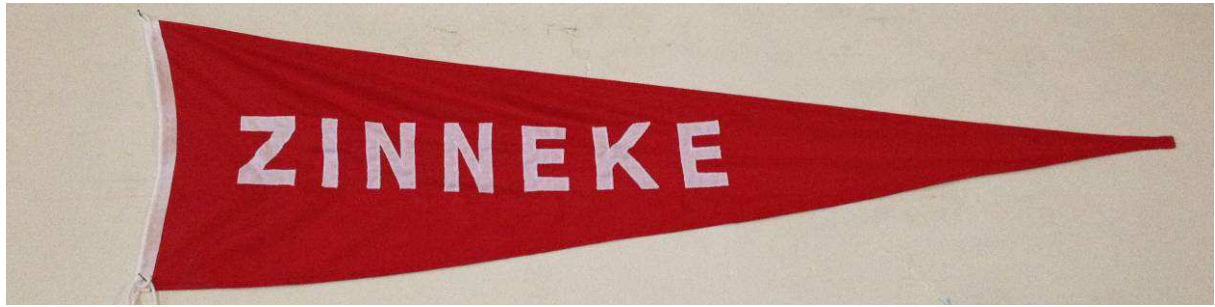
Evolution de la construction de la Yole de Bantry 'Zinneke', projet-phare de 2014