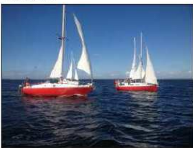
Il était fin prêt pour le départ des 23 Scouts Maars