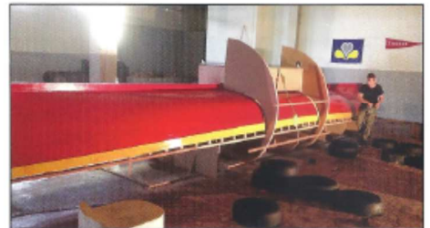
13 juillet : retournement à l'aide d'un dispositif rotatif