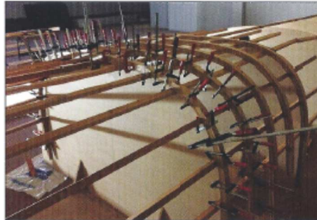
Mars-avril : lamelage des 43 membrures