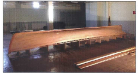
Fin juin : réalisation du bordé Galbord, vibord et fargue en chêne, le reste en orégon.

Le construction débute le 1 er février par la mise en place des gabarits, de l'étrave et de l'étambot.