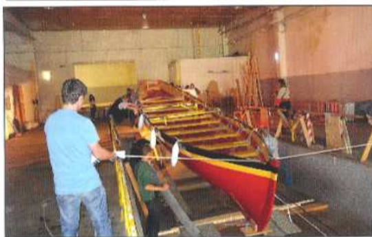
27 septembre : les grands moyens sont employés pour l'extraction du bateau de son atelier