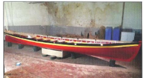
Août-septembre : aménagement intérieur